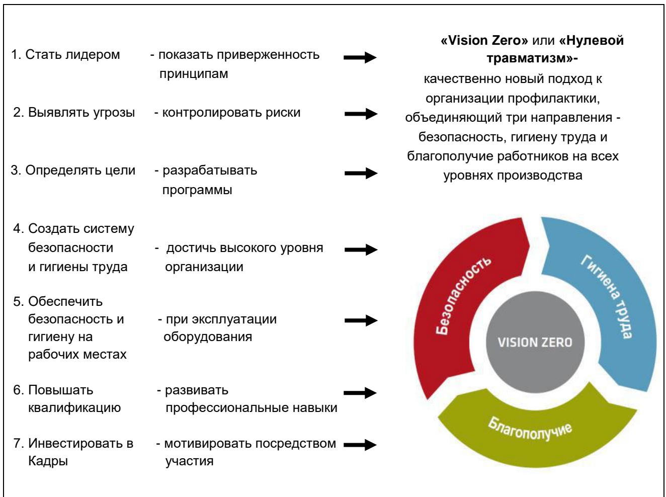
Рис. 1. Семь «золотых правил» производства с нулевым травматизмом и безопасными условиями труда (концепция «Нулевого травматизма» (Vision Zero))